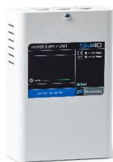
SM40 1A Mini